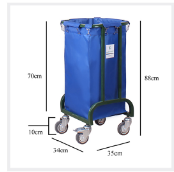
ابعاد کامل بدنه و بین برزنتی

این ترولی با ابعاد ۳۵x۳۴x۸۸ سانتیمتر مناسب جهت مکان های کوچک مناسب است. بین برزنتی این مدل با حجم ۷۵ لیتر به راحتی جدا شده و قابل شستشو و نظافت است.