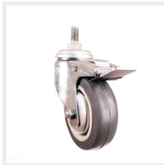
چرخ بزرگ ۳۶۰ درجه