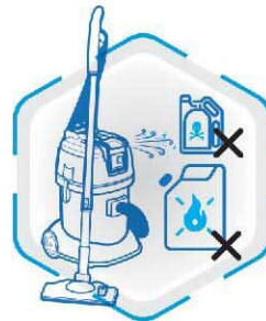
عدم مکش مواد مشتعل و سمی