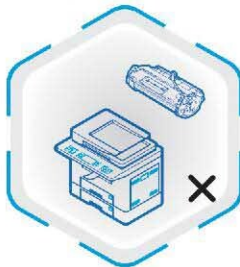
عدم مکش پودر تونر