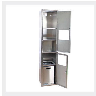
استفاده به صورت توکار