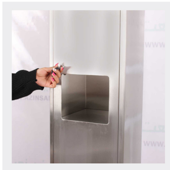
دارای درب قفل دار