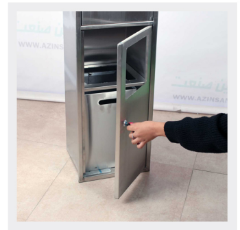
قرارگیری مخزن زباله

ست دست خشک کن، جادستمال و سطل زباله استیل J۲۰ به صورت توکار نصب میشود ، که به طور هم زمان جای دستمال کاغذی و سطل زباله استیل و دست خشک کن را در خود جای داده است. این محصول دارای درب قفل دار است و امنیت محفظه داخلی را برقرار میسازد. لوازم توکار باعث میشود که محل مرتب تر و استفاده از فضا راحت تر گردد.