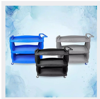
در سه رنگ متنوع