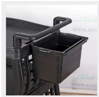
دارای سطل کناری